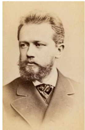
Peter Tschaikowsky, um 1880

Musik ist keine Illusion, sie ist Offenbarung. Und darin liegt ihre triumphierende Kraft, dass sie eine Schönheit offenbart, die uns in keiner anderen Sphäre zugänglich ist und uns mit dem Leben versöhnt. (Peter Tschaikowsky, 1877)